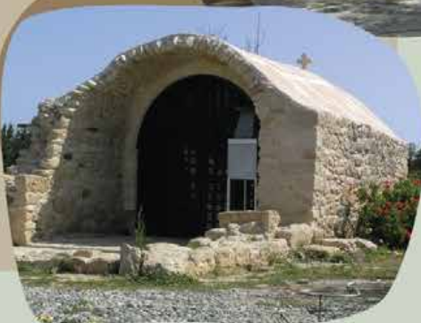
Παρεκκλήσι Αγίου Δημητρίου