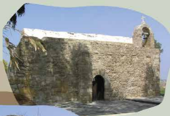
Παρεκκλήσι Αγίου Γεωργίου

Γραφικά παρεκκλήσια και ναοί από τον 9 ο μέχρι και τον 20 ο αιώνα βρίσκονται εξαπλωμένα κυρίως στη δυτική πλευρά της Χερσονήσου και περιμένουν να τα ανακαλύψετε.